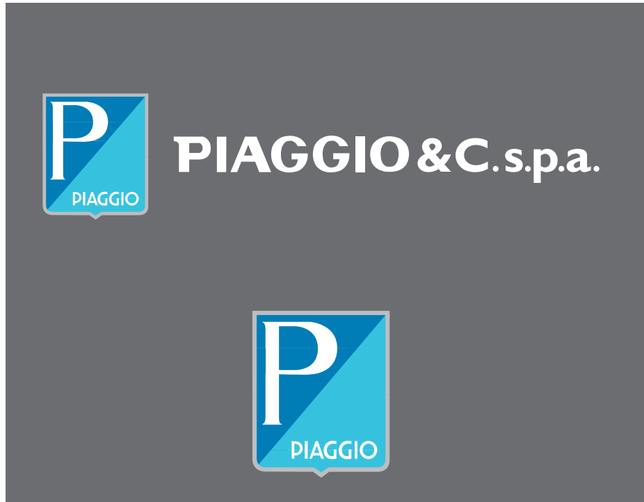
Logo versione a colori - lettering bianco • Coloured version - white lettering